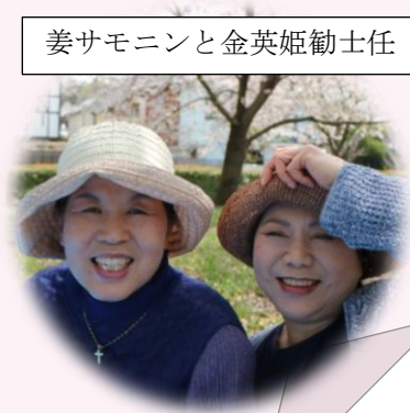
姜サモニンと金英姫勸士任