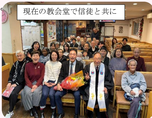
現在の教会堂で信徒と共に